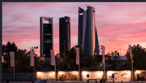
ZONA MAKING OF